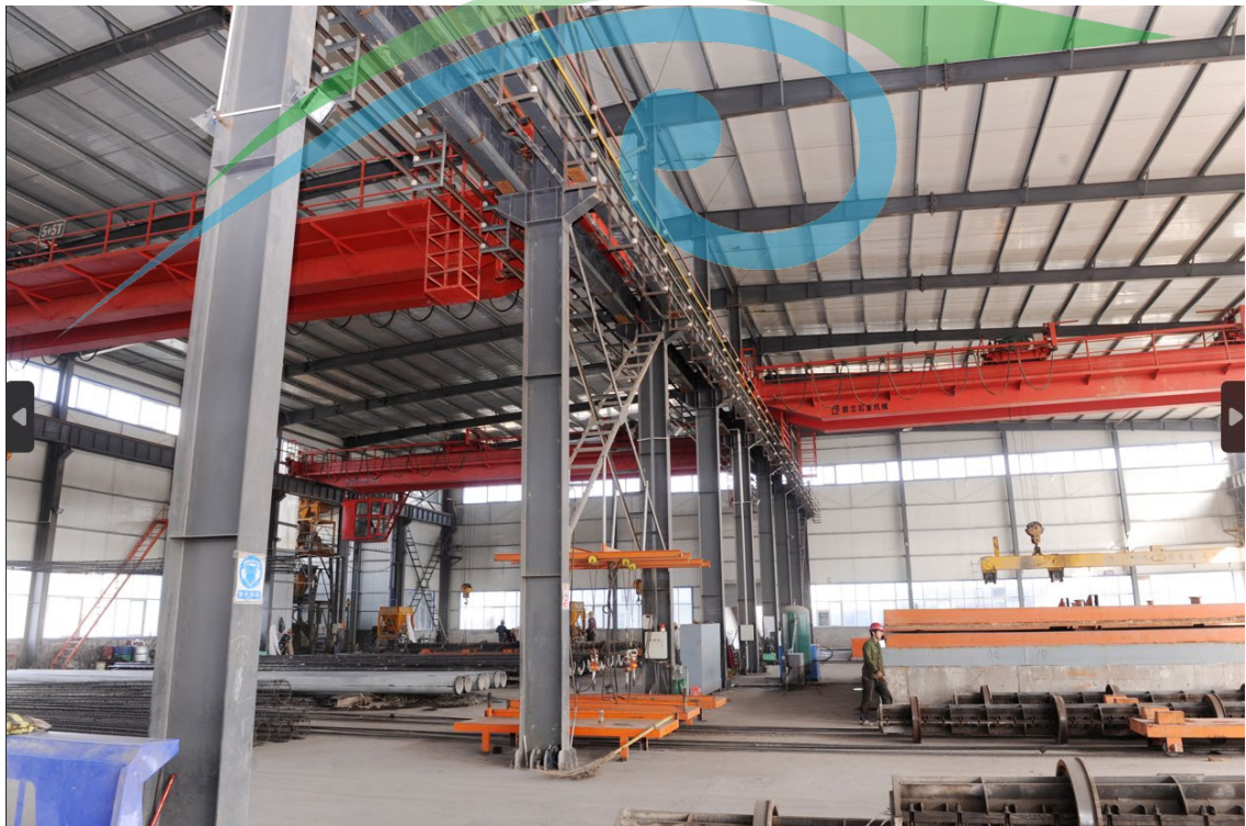
图 2-4 厂区设备照片