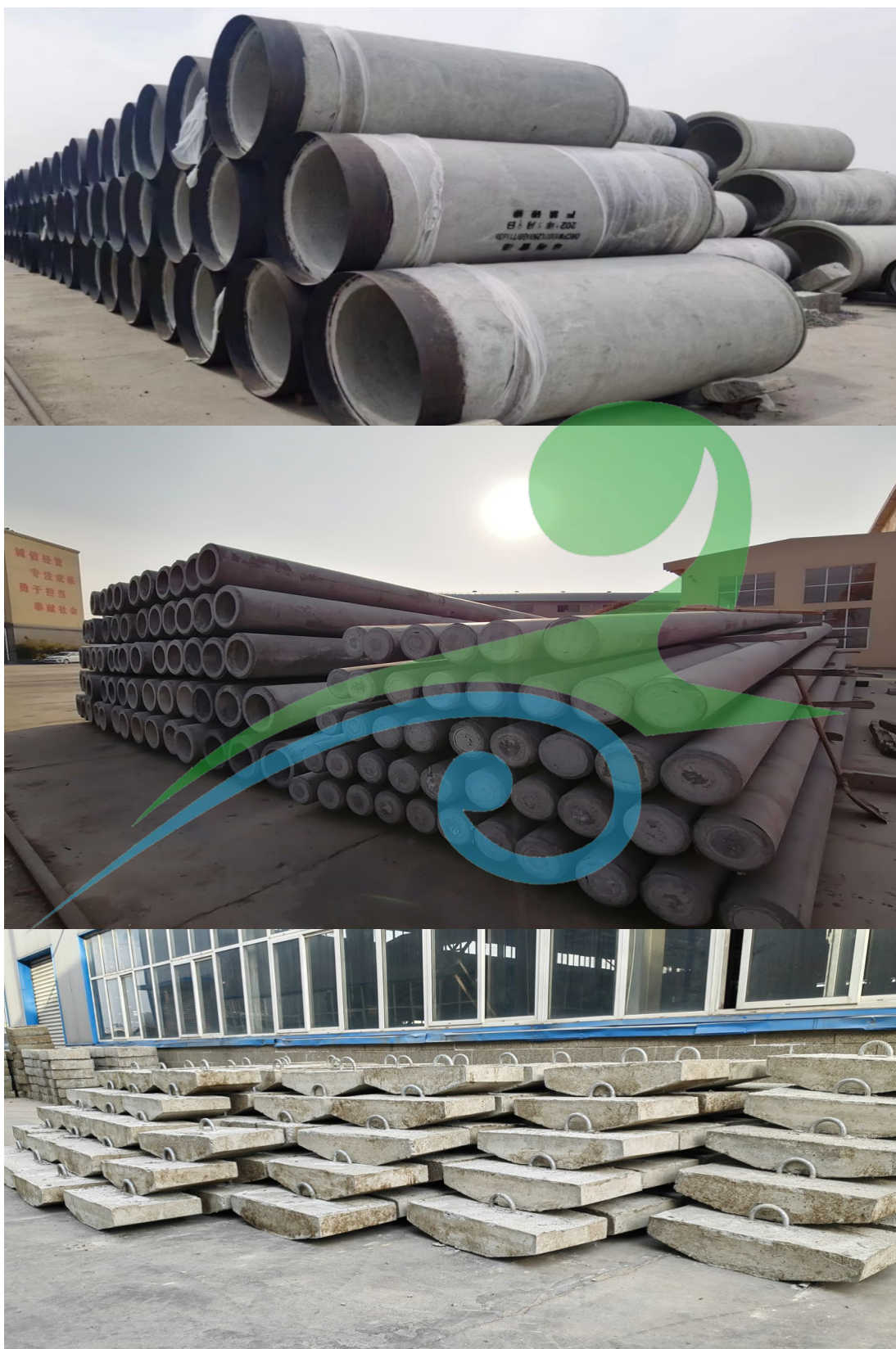
图 2-2 产品概貌